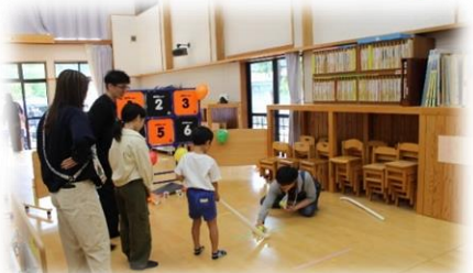
ホッケーストラックアウト