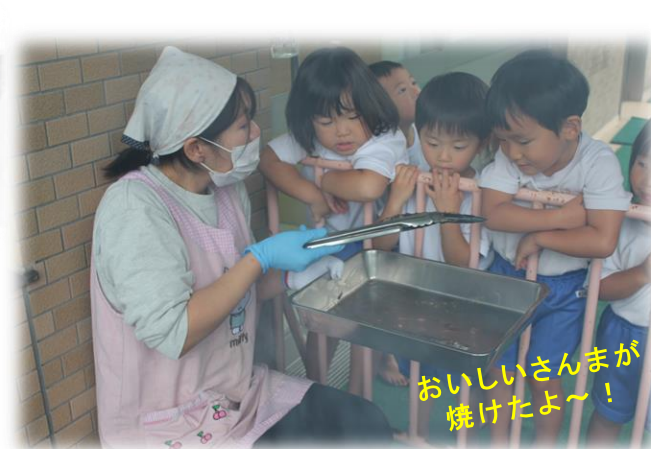
おいしいさんまが焼けたよ～!