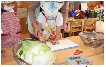
クッキング楽しいね！