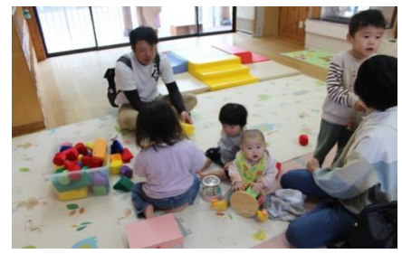
ゆったりコーナー

10月26日に「げんきまつり」を行いました。 ぞう・らいおん組の元気いっぱいのダンスのオープニングでまつりが始まり、お店が開店。 今年度は保護者役員さんもたくさんの店を準備して子どもたちが楽しめる盛りだくさんの内容 でした。子ども達も家族でそれぞれの店をまわって楽しんだり、作品展では自分たちが作った 作品を見てもらいみんな満足そうな表情をしていました。お家の人との会話も弾み笑顔で一 緒に過ごす姿がたくさん見られました。