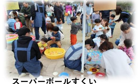
スーパーボールすくい