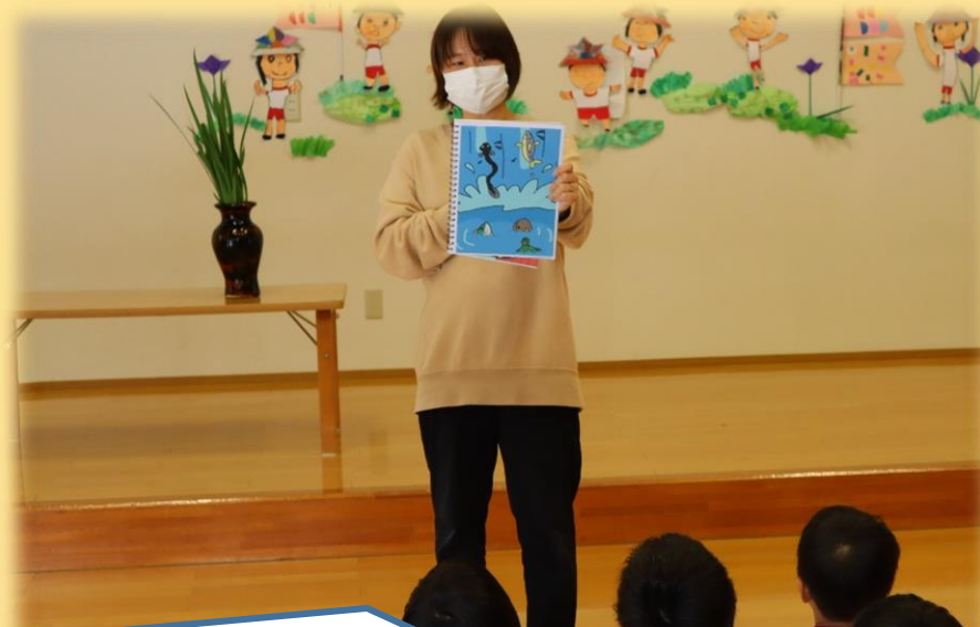
いろんな魚が滝を登ろうとしたけど、登れず・・・ 「あ～あ」と残念そうな子どもたちでした。