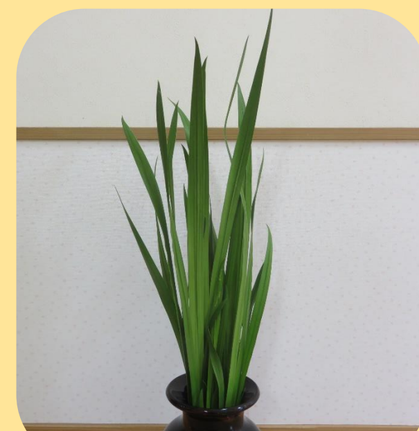
～ 菖蒲の葉 ～ 刀の形にも似ていて強そうだね！