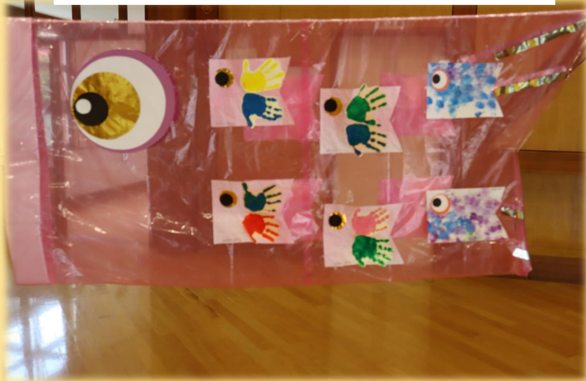
ひよこぐみ・りすぐみ