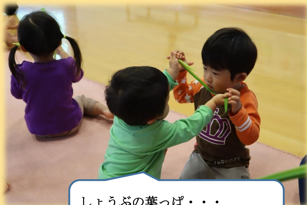
しょうぶの葉っぱ・・・ どんなにおいがするかな？

子どもたちの元気でたくましく健やかな成長を願い、みんなでお祝いすることができました。