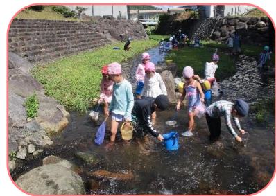
馬木や八川の友達と砂田川で遊んだり鳥上のお祭りに参加したりしました。

地域のお祭りにも参加し楽しかった気持ちから、「自分たちもおまつりをしよう！」ときりん組4歳児がおまつりをひらいてくれました。空き箱やカップを家から持って来ては毎日楽しそうに準備をしていました。小さいクラスの子どもたちもテーブルに並べられていくお祭り商品が増える度に「わくわく！」当日は開店前から「もうお祭りに行ってもいいですか？」ときりん組に聞きに行くほどでした。