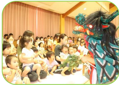
小森神楽の迫力ある舞に真剣に見入っていました

今年も暑い夏でしたが子どもたちは元気いっぱいいろいろな体験を重ね、心も体もたくましく成長したように感じます。自分からやってみようとする姿や友達と力を合わせて取り組む姿、一緒に楽しむ姿などがたくさん見られました。地域の方や他園の友達との交流もあり充実した夏を過ごした子どもたちです。ますますパワーアップした力を思いきり発揮して意欲的に生活していきたいと思ひます。