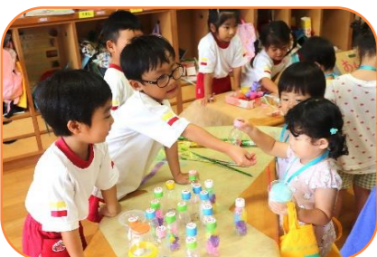
商品は完売！大盛況でした

地域のお祭りにも参加し楽しかった気持ちから、「自分たちもおまつりをしよう！」ときりん組4歳児がおまつりをひらいてくれました。空き箱やカップを家から持って来ては毎日楽しそうに準備をしていました。小さいクラスの子どもたちもテーブルに並べられていくお祭り商品が増える度に「わくわく！」当日は開店前から「もうお祭りに行ってもいいですか？」ときりん組に聞きに行くほどでした。