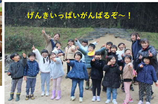
げんきいっぱいがんばるぞ～！