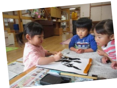
自分の好きなように筆を動かして書いたよ！！