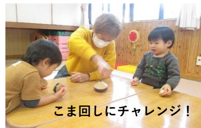
こま回しにチャレンジ！