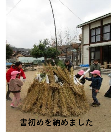
書初めを納めました