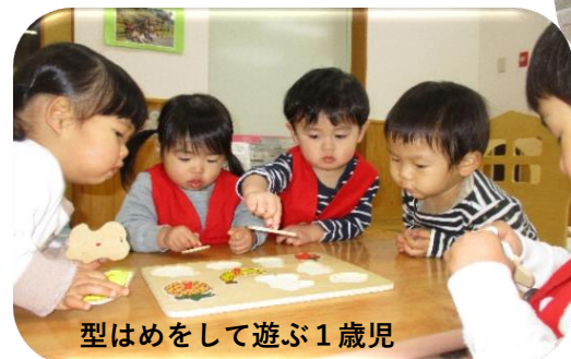
型はめをして遊ぶ1歳児

こま回しや羽根つき、カルタ、パズルなど様々な遊びに挑戦しています。それぞれの遊びに年齢ごとにねらいを持ちながら、保育士も一緒に関わりながら楽しんでいます。