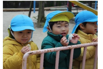
焼きたてのおもち！おいしい～