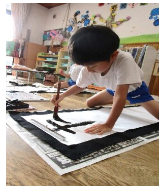
何を書くか決めて！ 真剣に書いています