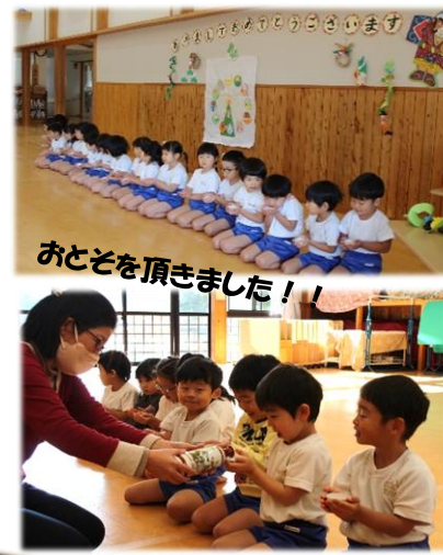
おとそを頂きました！