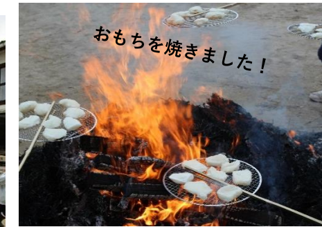
おもちを焼きました！