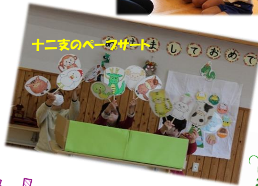
十二支のペープサート