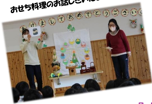
おせち料理のお話したいよ！

とんどさんで焼いたスルメを食べ「元気に過ごせますように！」と顔に墨をつけ、いい顔になりました。